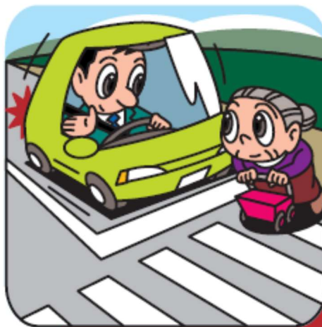
横断歩道は歩行者優先