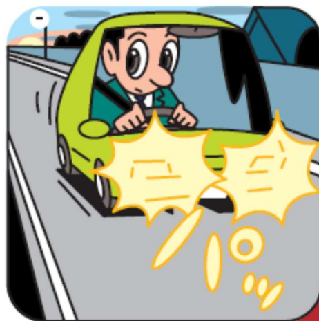
日没前にヘッドライト点灯

また、夜間においては、交通量の多い市街地などや、対向車と行き違うとき、前車の直後を走行しているときを除いて、ヘッドライトは可能な限り上向きにして、歩行者等の早期発見に努めましょう。