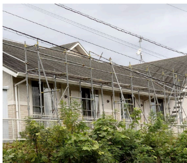
太陽光発電設備設置のための、足場工事を行います。