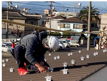
瓦棒の屋根に太陽光パネル設置のための取付金具の取付を行います。