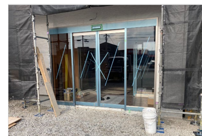
自動ドア設置工事