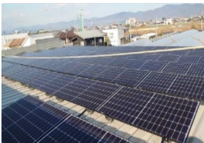
太陽光（モジュール設置）