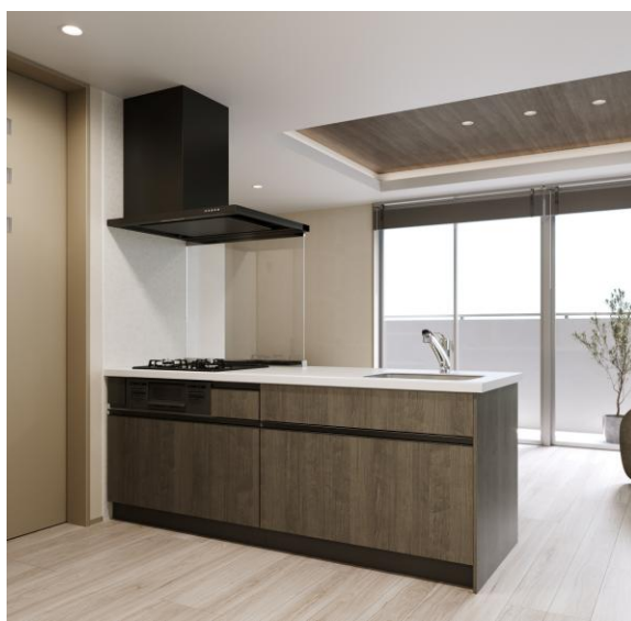
フラット対面キッチン間口2100mm