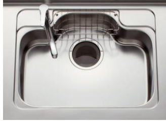
ラック付きシンク