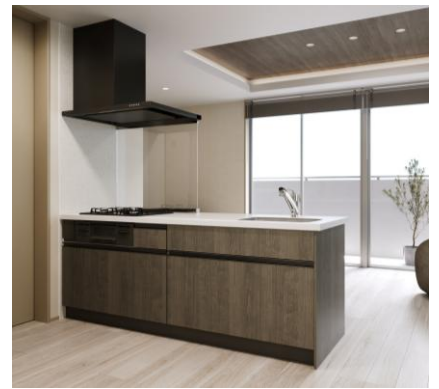
フラット対面キッチン間口2100mm