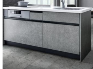
ブラックカラーの取っ手/けこみ