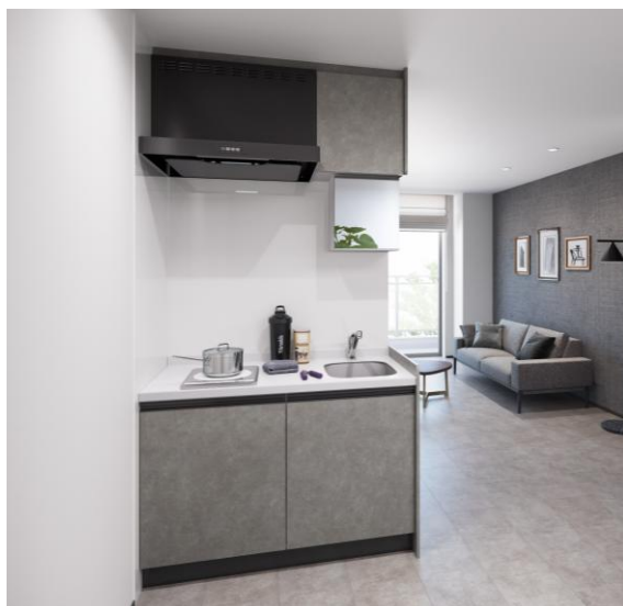
‘洗面兼キッチン’のご提案