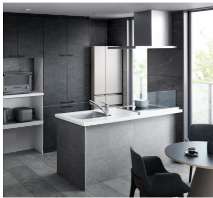
フラット対面キッチン間口1800mm