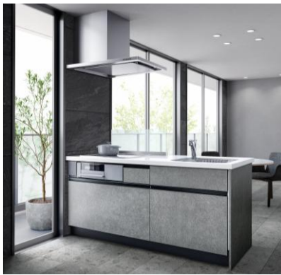
フラット対面キッチン間口1800mm