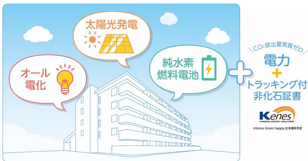
建物運用時 CO2 排出量実質ゼロ実現に向けた取組み