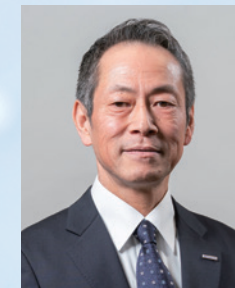
代表取締役 社長執行役員

私たちは、信頼性のあるサービスを通じて、より良い未来を築くことをお約束いたします。お客様とのパートナーシップを大切に、共に成長していくことを楽しみにしております。