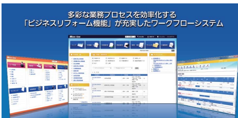
多彩な業務プロセスを効率化する 「ビジネスリフォーム機能」が充実したワークフローシステム

「MajorFlow」は、iPadからの申請・承認もでき、書類を電子化するだけでなく、経費精算・勤怠管理・稟議決裁・購買発注決裁・各種届出・報告書など、多彩な業務プロセスを効率化する「ビジネスリフォーム機能」が充実したワークフローシステムです。業務の目的別に3種類のラインナップからお選びいただけます。