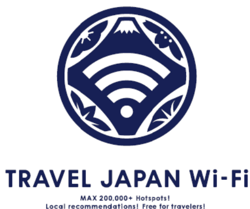
図2：サービスブランドロゴ