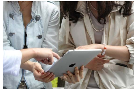
【タブレット PC からの視聴イメージ】