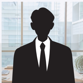
IT・通信・ソフトウェア・情報処理業 マーケティング DX 担当 執行役員

これまでは自ら戦略を策定し、トップダウンで推進することが多かったのですが、社員の自主性を引き出すことの重要性を改めて認識しました。特に、ビジョンを共有し、チームの意見を集約しながら進めることで、組織のエンゲージメントを高められている手ごたえを実感しています。