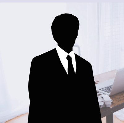
ハウスメーカー 営業本部 副部長

少人数制で懇親の場もあるので、参加者同士のコミュニケーションがしっかり図れ、研修期間後も相談できる仲間ができます。一見難しそうなかリキュラムもありますが、講師の方々も、やさしくわかりやすく指導して頂けるので、ぜひ様々な業種の方に参加して頂いて、各個人や各会社の成長につなげていただければと思います。