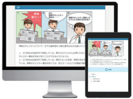
画面はイメージです