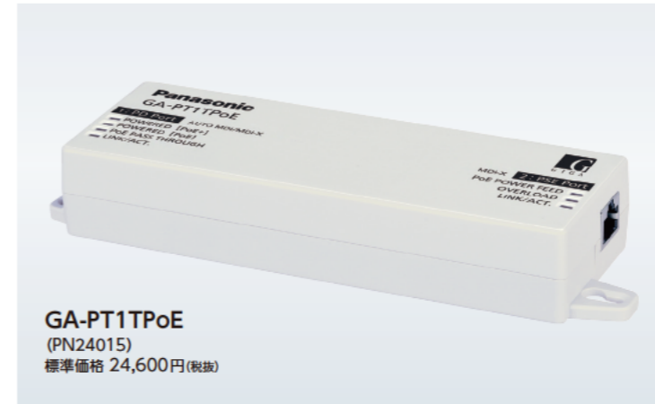
GA-PT1TPoE (PN24015) 標準価格 24,600円(税抜)