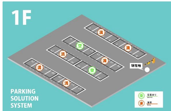
駐車状況マップイメージ（駐車場各階）

標準ソフト（無償）のマップ表示機能を使用する事でサイネージなどに駐車状況を表示する事ができます。管理者はもちろん、施設に来院されるお客様にも快適に駐車場を利用していただく事ができます。