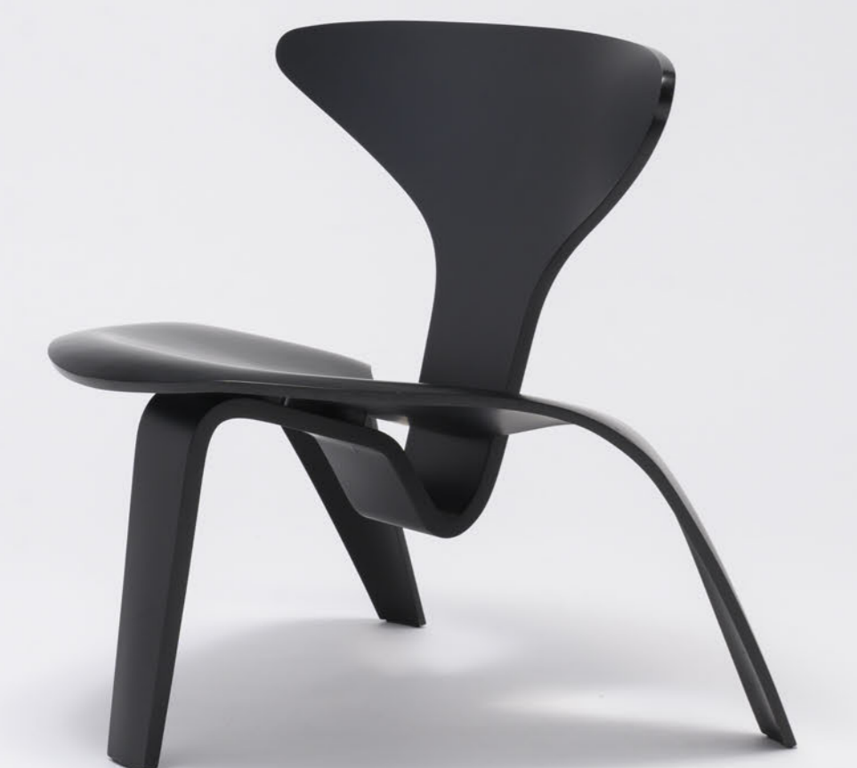
ポール・ケアホルム 〈PK 0〉1952年 成型合板(塗装) Poul Kjærholm, PK 0, 1952