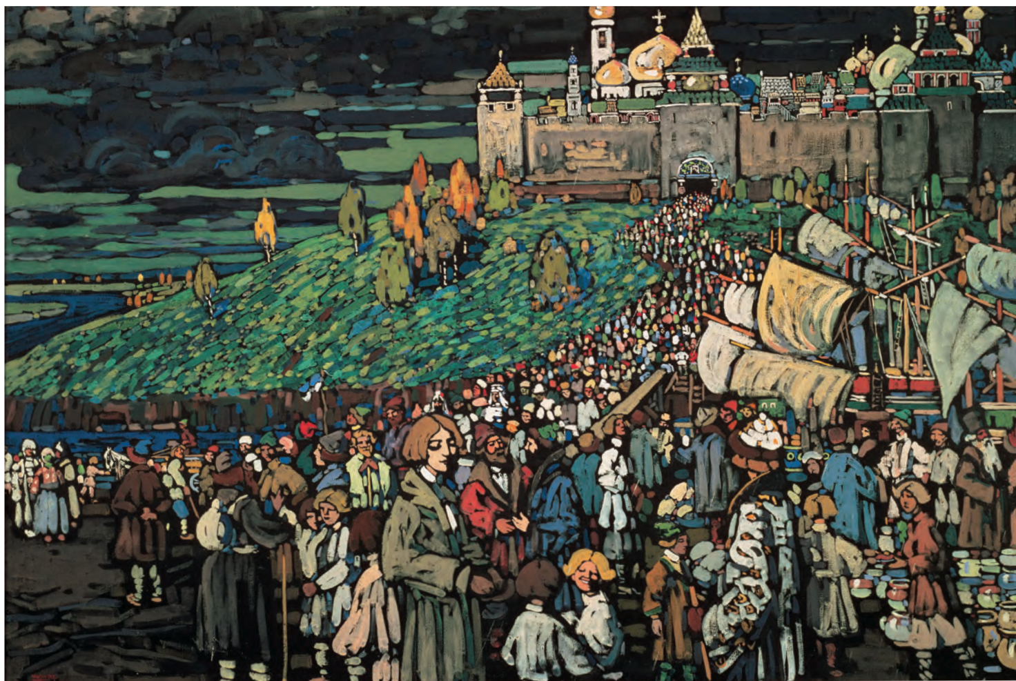
② ヴァシリイ・カンディンスキー《商人たちの到着》1905年 宮城県美術館蔵