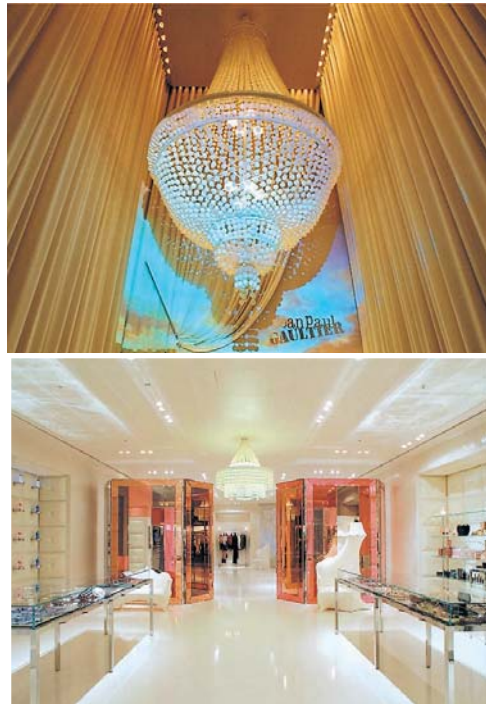
ショップ ジャン・ポール・ゴルチエ 納入品目 ▶ 照明器具・特注品・保守