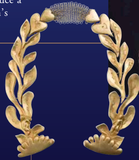
リーン・ヴォートラン 《オープンネックレス「エデンの園のアダムとイヴ」》 1947年頃、金色ブロンズ、メタルチェーン Line Vautrin, Open Necklace "Adam and Eve in the garden of Eden", c.1947, golden bronze, metal chain