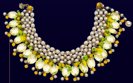
ミリアム・ハスケル《ネックレス》 デザイン：フランク・ヘス、1950年代、模造パール、シドリン、ガラスペースト、メタル Miriam Haskell, Necklace designed by Frank Hess, 1950s, imitation pearls, citrine, glass paste, metal

【表作品】左上より時計回りに クリスチャン・ディオール《ブローチ「白鳥」モチーフ》制作：ミッCHEL・メイヤール、1954年頃、ラインストーン、模造パール、メタル / メゾン・グリボワ《イヤリング》デザイン：ジョゼット・グリボワ、1989年、バード・ドゥ・ヴェール・エナメル ガラス、カボションガラス、模造パール、メタル / スキヤパレリ《ネックレス（裏）》デザイン：ジャン・クレモン、1937年頃、クリスタルガラス、メタルメッシュ / クリスチャン・ディオール《ネックレス、イヤリング》制作：ミッCHEL・メイヤール、1954年頃、ラインストーン、模造パール、メタル / シャネル《ブレスレット「ビザンチンクロス」》制作：ロベール・ゴッサン、1960年頃、ガラスビーズ、メタル / 所蔵は*印は個人蔵、それ以外は小瀧千佐子蔵。 Works on the reverse side, clockwise from top left. Christian Dior, Brooch "Swan" motif produced by Mitchel Maer, c.1954, rhinestones, imitation pearls, metal / Maison Gripoux, Earrings designed by Josette Gripoux, 1989, part de verre enameled glass, cabochon glass, imitation pearls, metal / Schiaparelli, Necklace "Leaf", designed and produced by Jean Clement, c.1937, clear enameled metal, metal mesh / Christian Dior, Necklace and earrings produced by Mitchel Maer, c.1954, rhinestone, imitation pearl and metal / Chanel, Necklace "Byzantine Cross" produced by Robert Goossens, c.1960, glass beads, metal / Collection marked with an asterisk is in private collection, all others are in the collection of Chisako Kotaki.