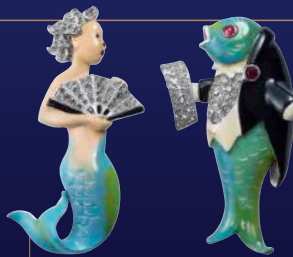
トリファリ《ペアクリップ「テノールフィッシュとマーメイド」》 デザイン：ジョセフ・ワイツ、1940年、エナメル形メタル、ラインストーン、ガラスペースト Trifari Pair clip "Tenor Fish & Mermaid" designed by Joseph Wuyts, 1940, enameled metal, rhinestones, glass paste