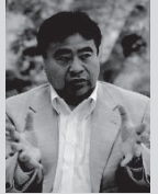
東大グリーンICTプロジェクト代表 東京大学大学院情報理工学系研究科 江崎浩 教授

環境・エネルギー問題は、これから人類が生き残り、繁栄と発展を持続・継続するために解決しなければならない21世紀の最重要課題の一つと認識しなければなりません。この問題の解決には、日本の貢献が必須であり、技術と人の両面での貢献が地球と人類への責任です。エネルギー管理の技術領域は、21世紀に入り、その革新が加速していますし、多数の技術領域が融合しなければならず、複数技術領域の俯瞰など、これまでとは異なる知識と経験が必要となります。